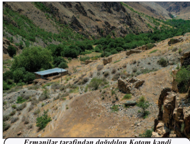
Ermənilər tərəfindən dağıdılan Kotam kəndi

Azərbaycan xalqının tarixi həmişə böyük Türkiyə xalqının taleyi ilə sıx bağlı olmuşdur. XX əsrin əvvəlində Mustafa Kamal Atatürkün rəhbərliyi ilə milli istiqlal müharibəsində qələbə çalaraq Türkiyə Cümhuriyyətini yaradan türk xalqı Azərbaycan xalqının milli müstəqilliyinin qorunmasında və Cənubi Qafqazda sülhün təmin edilməsində maraqlı idi. Məhz elə buna görə 16 mart 1921-ci ildə Türkiyə ilə Rusiya arasında bağlanan Moskva və 13 oktyabr 1921-ci ildə Türkiyə, Rusiya, Azərbaycan, Cürüstən və Ermənistan arasında bağlanan Qars müqaviləsində Azərbaycanın ərazi bütövlüyünün təmin olunması öz əksini tapmışdı. Bu baxımdan Qars müqaviləsi, xüsusilə əhəmiyyətli idi. Bu müqavilədə Azərbaycanın ərazi bütövlüyü təmin olunmuş, Naxçıvana Azərbaycanın tərkibində muxtariyyət verilməsi öz əksini tapmışdı. Müqavilənin 5-ci maddəsinə əsasən Ermənistan Naxçıvan bölgəsinin Azərbaycanın himayəsində muxtar ərazi təşkil etməsinə razı olmuş və onun sərhədlərini tanımışdı. Qars müqaviləsinin 1-ci maddəsinə əsasən müqaviləni imzalayan tərəflər, o cümlədən Ermənistan indiyədək imzalanan müqavilələri ləğv olun-