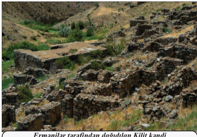
Ermənilər tərəfindən dağıdılan Kilit kəndi

çıvanın ərazisindədir. Lakin XIX-XX əsrlərdə kapitalizmin inkişafı, formalaşan imperiyalar xalqımızın ərazi bütövlüyü və Naxçıvan üçün yeni təhlükə yaratmışdır. XX əsrin əvvəlində kəskinləşən imperialist müharibələri, xüsusilə təhlükəli olmuşdur.